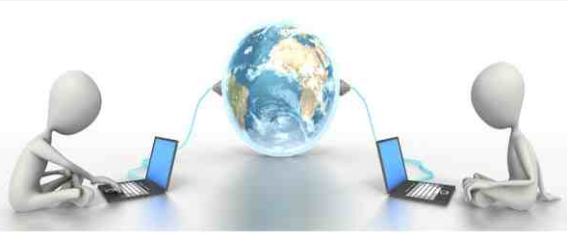
World Computer Literacy Day

ഇന്നത്തെ ആധുനിക യുഗത്തിലെ അതിവേഗം വർദ്ധിച്ചുകൊണ്ടിരിക്കുന്ന സാങ്കേതികവിദ്യയും ഡിജിറ്റൽ വിപ്ലവവും കാരണം കമ്പ്യൂട്ടറുകൾ മനുഷ്യജീവിതത്തിന്റെ ഒരു പ്രധാന ഭാഗമായി മാറിയിരിക്കുന്നു. കമ്പ്യൂട്ടറിനെക്കുറിച്ചുള്ള അറിവ് ഇപ്പോൾ വളരെ പ്രധാനമാണ്, കാരണം ഇത് വളരെ കൃത്യവും വേഗതയുള്ളതും നിരവധി ജോലികൾ എളുപ്പത്തിൽ നിർവഹിക്കാൻ കഴിയുന്നതുമാണ്.